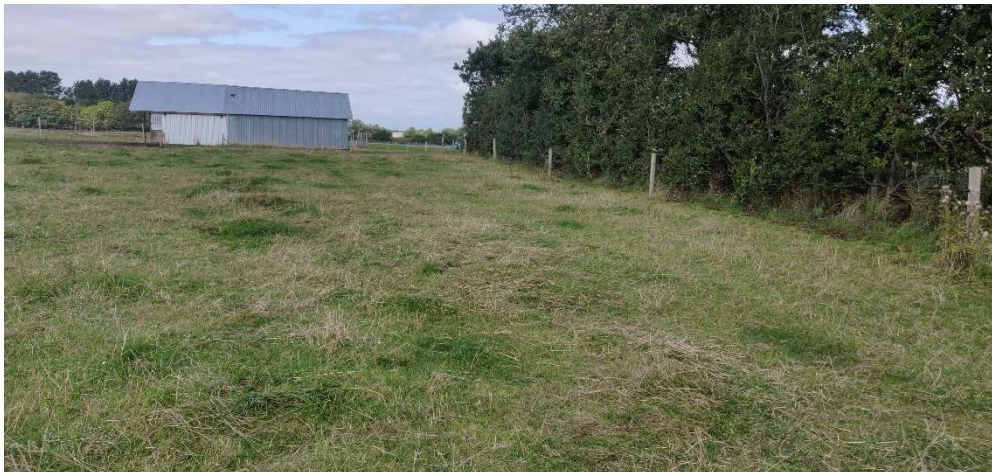
Figur 2. Engen, hvor drivvejen skal løbe langs læhegnet

Dispensationen er ikke længere gyldig, hvis den ikke udnyttes inden 3 år fra i dag eller ikke har været udnyttet i 3 på hinanden følgende år.